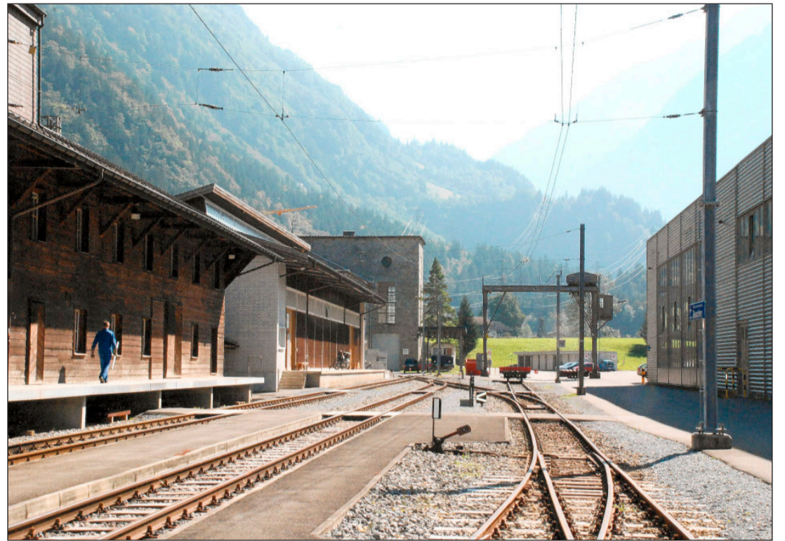
Endstation: Das Schienennetz im Oberhasli endet hier bei den Kraftwerken in Innerkirchen. Ein Student prüft, ob sie von hier geradeaus Richtung Grimselpass weiterführen soll.